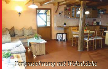
Ferienwohnung mit Wohnküche