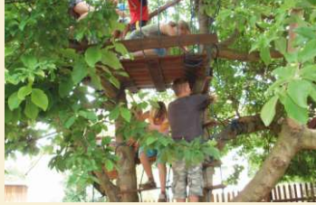
Lehmspielplatz mit Kletterbaum